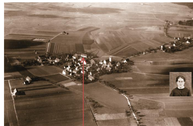
Liggersdorf um 1920