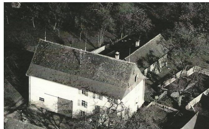
Liggersdorf, Hauptstraße 11, Philipp – Engelbert – Benkler – Bosch - Greinacher