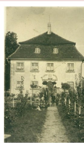
Hofgut und Gasthof Schernegg