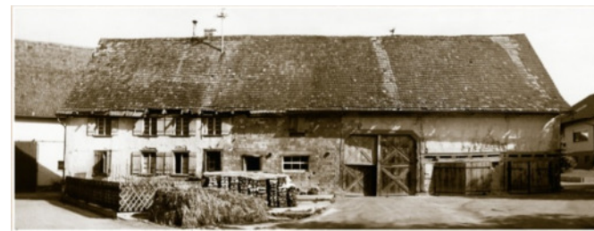
Geburtshaus Korbinian Brodmann